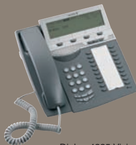
Dialog 4225 Visio