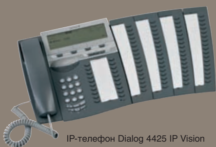
IP-телефон Dialog 4425 IP Vision

Пользователям, которые подключены к системе связи MX-ONE™ Telephony Switch, доступны следующие средства: пользовательские приложения D.N.A., такие как Ericsson Communication Assistant — веб-средство для